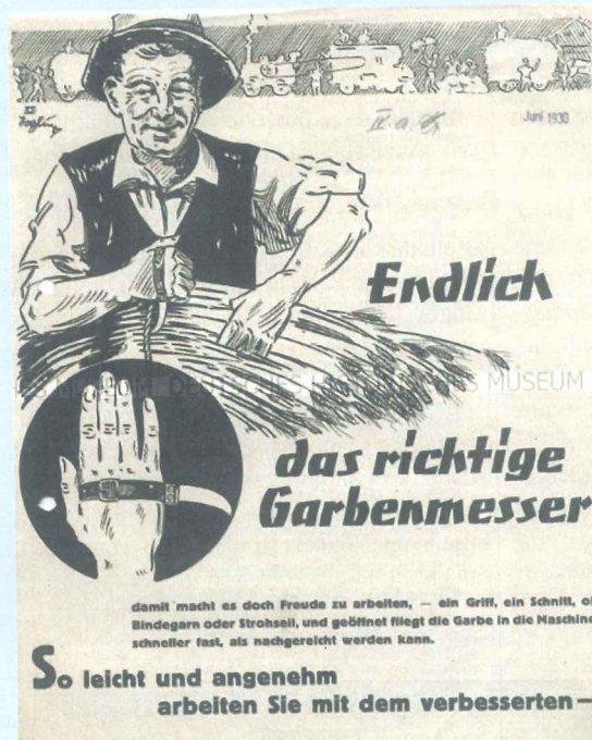
Njemački plakat naslova „Endlich das richtige Garbenmesser“ tiskan 1930. godine koji pokazuje „srbosjek“ kao poljoprivredni alat.