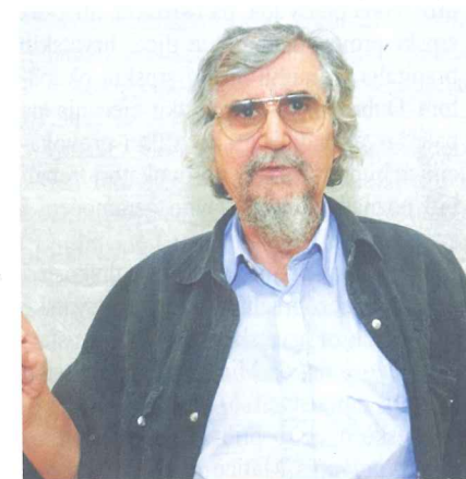
Piše: dr. sc. STIJEPO MIJOVIĆ KOČAN

Da u bratstvu i jedinstvu stalno i trajno budemo za Dom spremni, što je čin domoljublja i državotvornosti, izvan bilo koje ili bilo čije ideološke pripadnosti