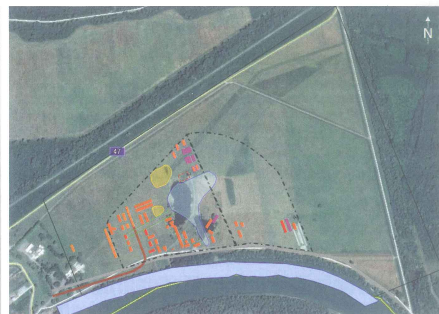
Modificirani nacrt logora Jasenovac prema Zemaljskoj komisiji superponiran na satelitsku snimku lokacije logora

Na superponiranoj karti logora mogu se vidjeti promjene na reljefu terena u odnosu na 1945. godinu. Najuočljivija je pro-