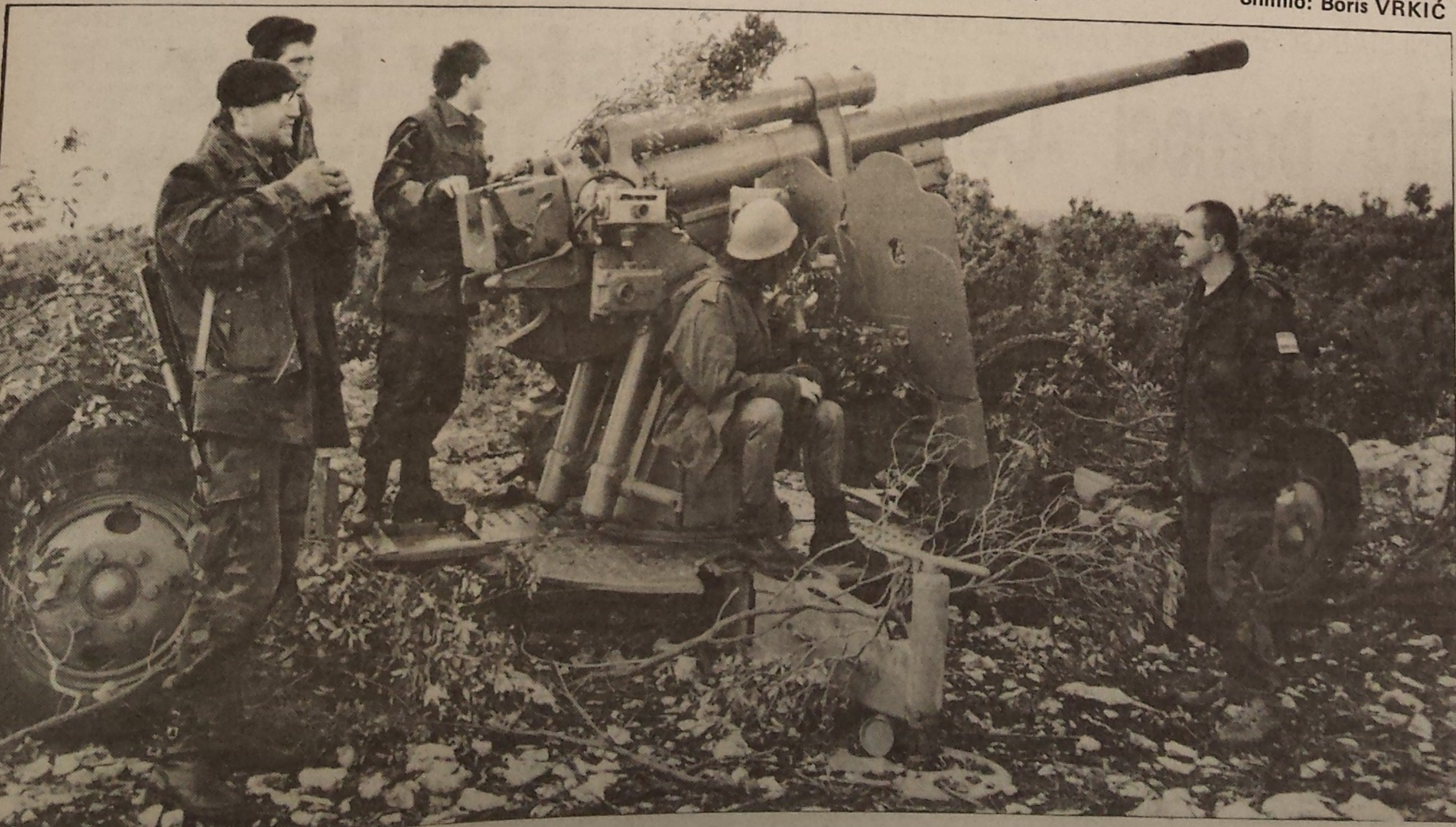
Ubojite šoltanske cijevi