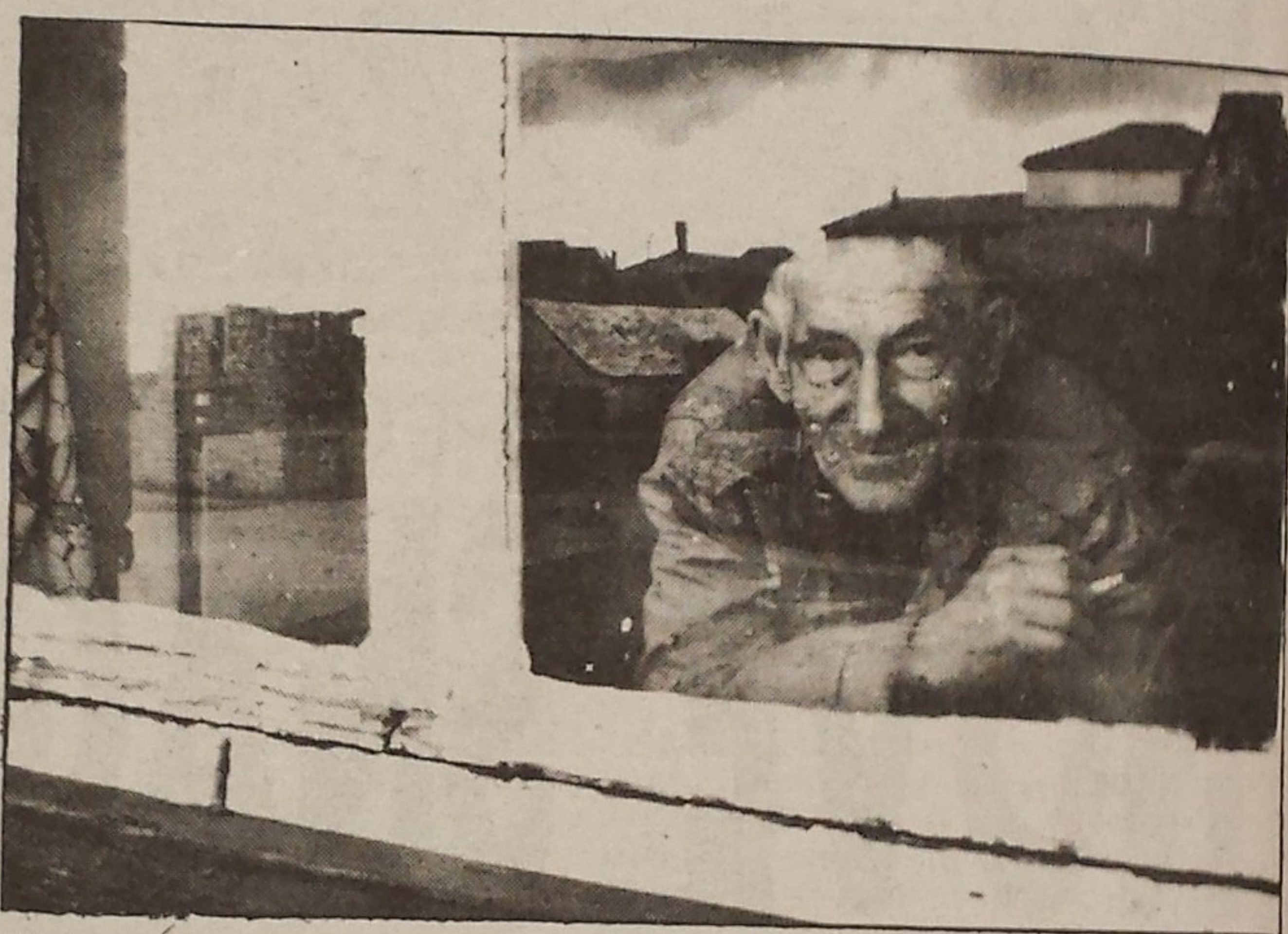
Oluja nad Gornjim Selom, odraz s prozora, uz prozor starac. Kažu da je to sve rjeđa šoltanska slika. Dolaze mladi. I oni najmladi