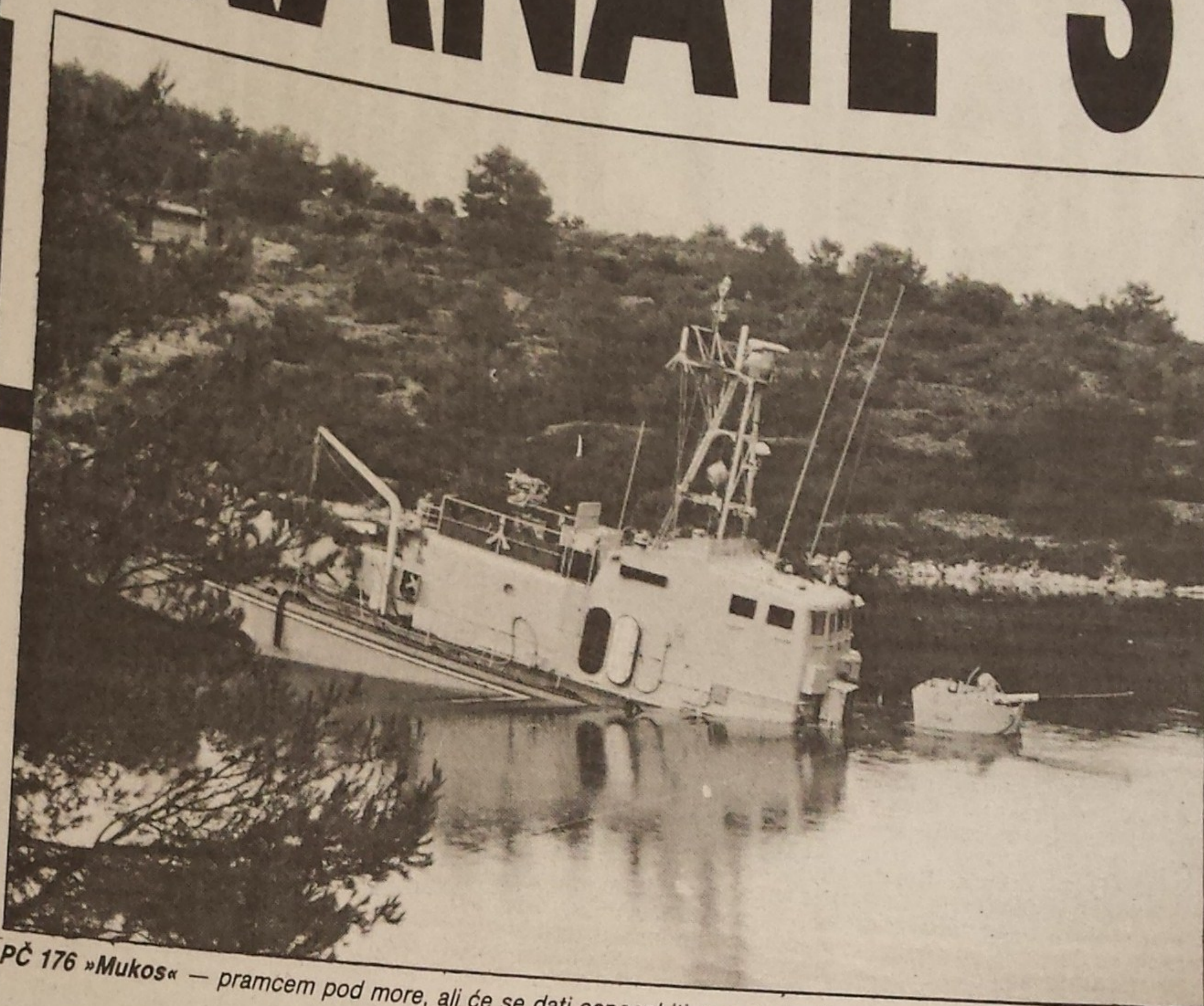
PČ 176 »Mukos« — pramcem pod more, ali će se dati osposobiti za potrebe Hrvatske ratne mornarice

Od deset topničkih granata ispaljenih sa šoltanskih baterija četiri su pogodile cilj, a čak tri razarač »Split«, i to na neviđeno. »Split« se naime pokušao spasiti u »zavjetrini« šoltanske obale, izvan vidokruga topova, ali mu ni to nije pomoglo