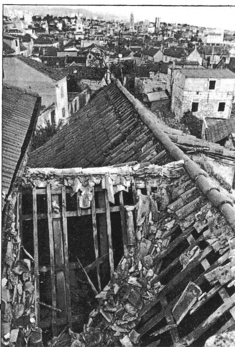
Prizor iz Ivančičeve ulice — »strateški cilj« jugomornarice (F.K.)

Razaranju Splita nije prethodila nikakva provokacija s hrvatske strane, a sve vojne bile su deblokirane — Pažnja, neeksplozirane granate! — Sirene za uzbunu nisu zakasnile