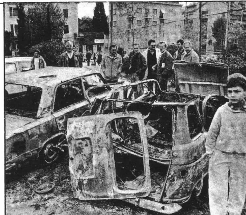
N.Bk. Parkiralište u Zrinsko-Frankopanskoj — ružno i tužno (M.B.)

Zapaljeni su granatama ispaljenim s brodova, i to na parkiralištu kod starog Hajdukova placa, i ispod Kotečkova nebodera koji je bio jedna od meta. Jutros smo u Policijskoj upravi pokušali saznati tko su vlasnici bivših »renaulta«, »lada« i »golfova«, ali tamo nam kažu da ne znaju, jer se vlasnici nisu javili, pa su policijske ekipe za uvidjale koje su jučer obilazile grad i bilježile štete registrirale automobile kao samo dio uništenog. Pretpostaviti je da se vlasnici zapaljenih automobila nisu javili jednostavno zato što su svjesni toga da im gubitak ne može nitko nadoknaditi. Osiguravajuća društva naime, u svojim klauzulama nisu predviđjela rat, a vojska neće platiti — garant!