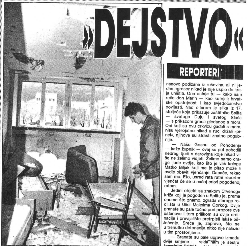
»Omladinski hotel« — u ovim su krevetima za koji dan trebali spavati daci

Splitski umjetnici spremni su nastupati u dobrotvoljne svrhe i u svojoj domovini.