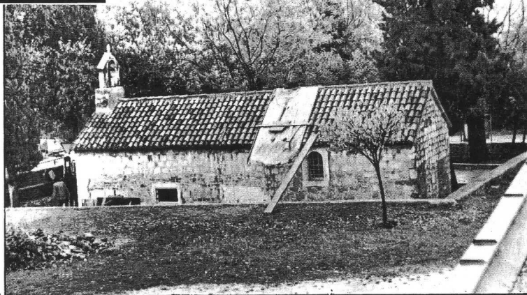
Crkvica Gospe od Pohođenja u Spinutu, koja datira još iz 5. stoljeća, ranjena je granatom, ali se kao Feniks uzdiže iz ruševina po deset put u svojoj dugoj povijesti

Mnoštvo mladih u punom radnom zamahu uređuje pogođenu crkvicu Gospe od Pohođenja na Spinutu — U Domu zdravlja stradale dvije ordinacije i previjalište — Sreća je što nikoga nije bilo u Omladinskom hotelu jer su tamo dvije teške granate napravile pravu pustoš