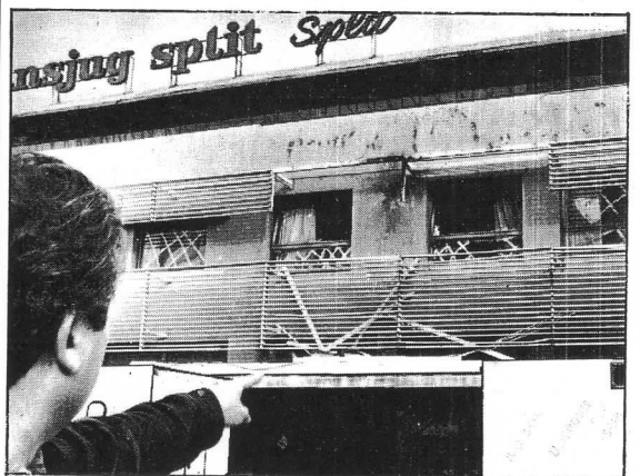
Metalna rešetka aktivirala je granatu i spriječila veće razaranje zgrade lučkog terminala

koje će se u crkvi obaviti. Nedjeljna misa će se također normalno održati jer život teče dalje i tako će teći. Ova crkva je zadnji put rušena u vrijeme Turaka, a zadnji put renovirana prije 11 godina. Deset puta je poput Feniksa