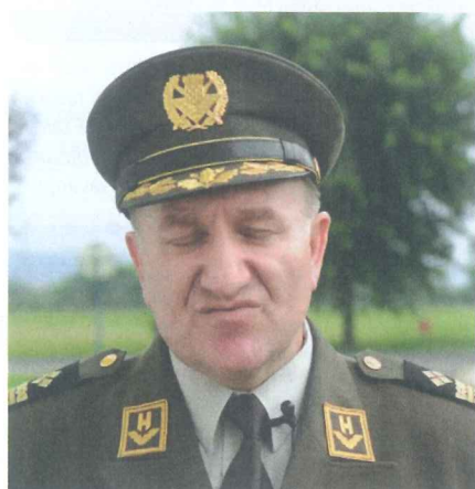
Glavnoga stožera Oružanih snaga Republike Hrvatske 29. srpnja 2015. godine predložili