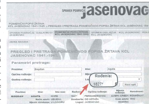
Jedna od nelogičnosti jasenovačkoga popisa: Agata Bogdan je u trenutku smrti imala 115 godina

Je li preuzimanje podataka o navodnim žrtvama iz srpskih memorandumskih pamfleta u kojima uglavnom nedostaju ključni identifikacijski podaci ili su autori srpski ekstremisti koji zagovaraju lažne teze o 700.000 i više stradalih u Jasenovcu. strateški interes JUSP-a?