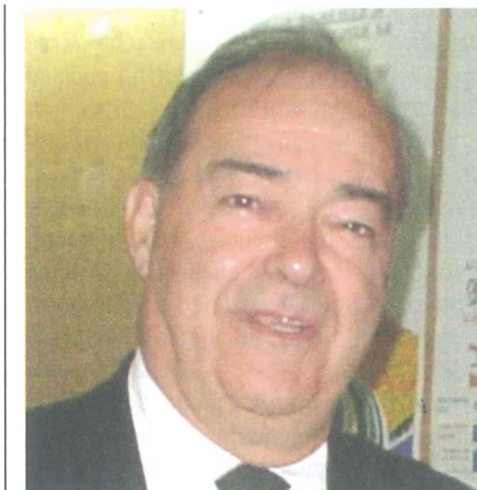
Piše: NIKOLA ANDONOV

Kao i u mnogim tranzicijskim zemljama u Europi, tako je i u Republici Makedoniji započela izgradnja nove društvene svijesti čija je polazna točka bila odavanje počasti žrtvama komunističkoga režima. To je u